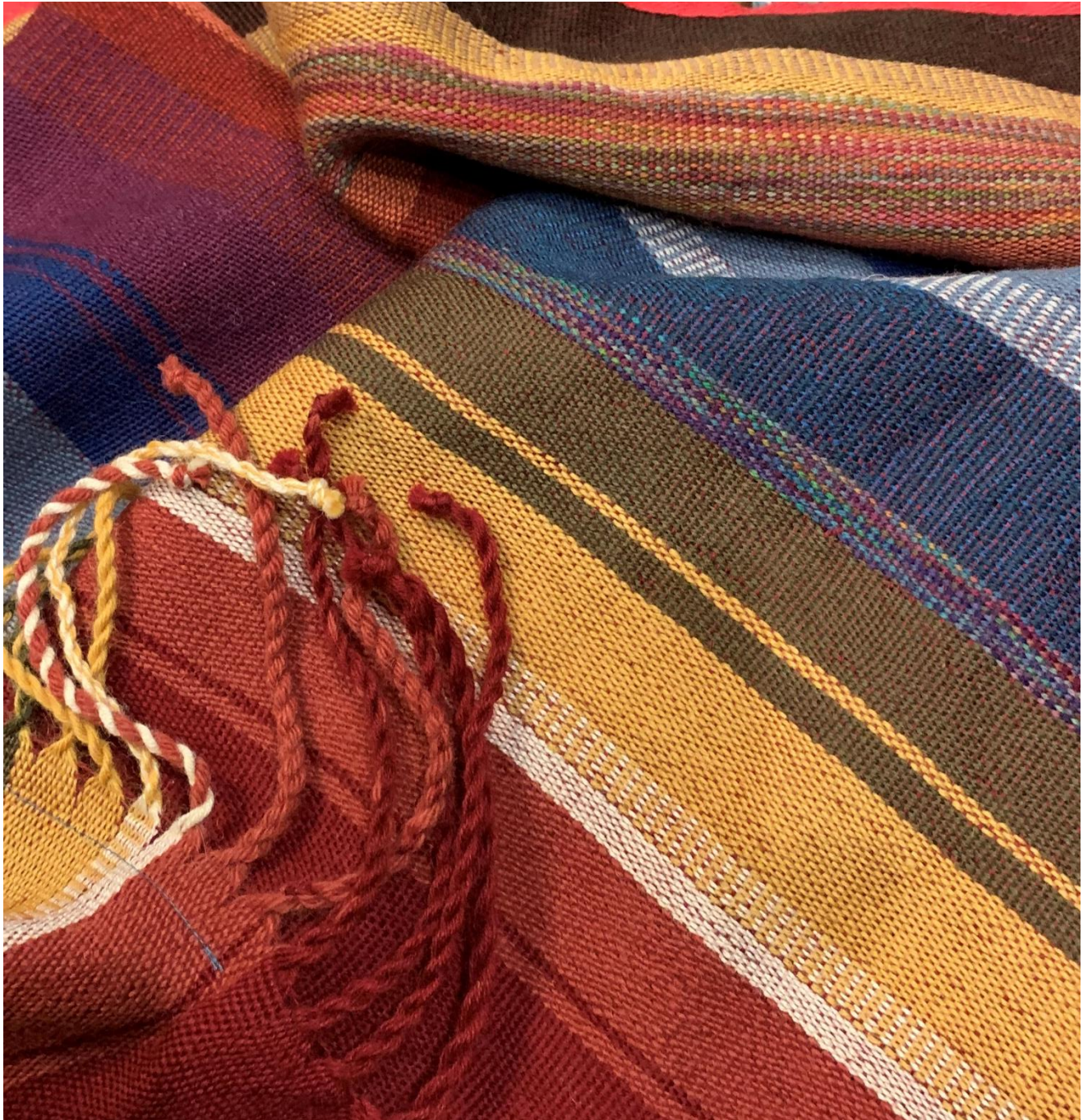
Wollen poncho van Evelien Blok